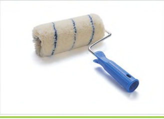
DIŞ CEPHE RULOLARI