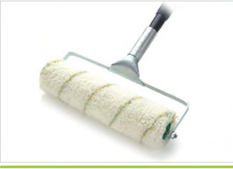
PLASDEK BOYA RULOLARI