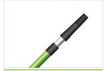
ALÜMİNYUM İNCE SIRIKLAR