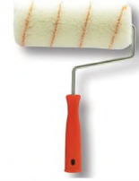
DIŞ CEPHE RULOSU