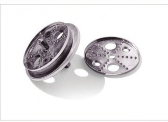
STRAFOR AÇICI PANÇLAR