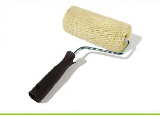
DEKORATİF DIŞ CEPHE RULO