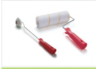
EKSPORT SATEN BOYA RULO