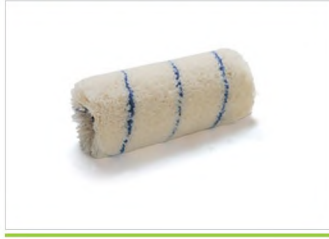
DIŞ CEPHE RULO YEDEKLERİ