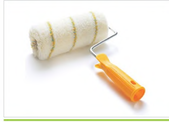
İÇ CEPHE RULOLARI