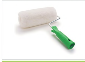
PÖSTEKİ BOYA RULOLARI