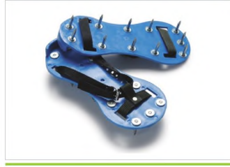
EPOKSİ AYAKKABI ve MASTAR