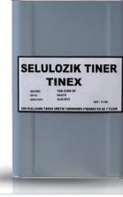
SELÜLOZİK TİNER TENEKE