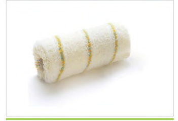
İÇ CEPHE RULO YEDEKLERİ