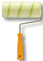
İÇ CEPHE RULOSU