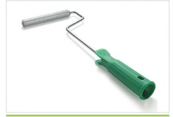
ALÜM. ELYAF EZME RULOLARI