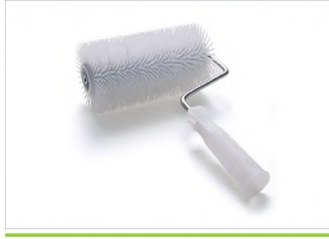
EPOKSİ KİRPİ RULOLAR